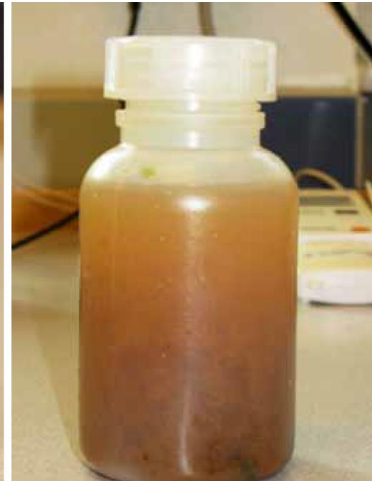
Bild 11. Närbild på prov från vägdike