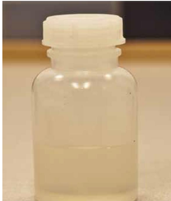
Bild 10. Närbild på prov ut från våtmarken