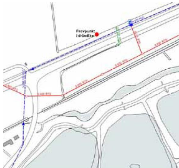
Bild 12. Plats för prov i vägdike. Gröna linjer anger dagvatten