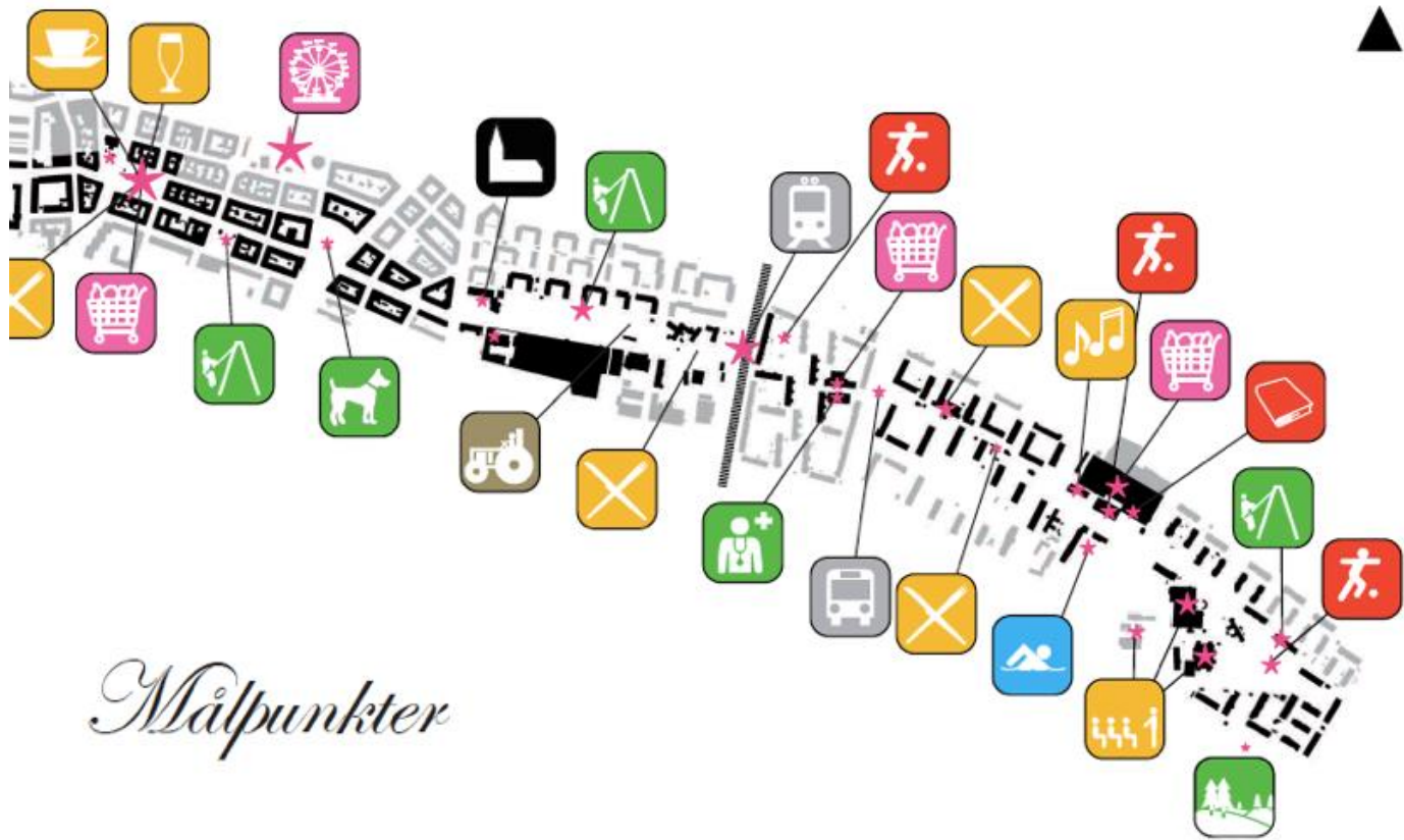
Rosengårdsstråket, Malmö stad, gatukontoret