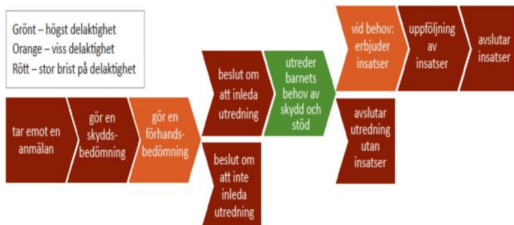
Figur 1 Barns delaktighet i ärenden som berör dem efter granskning av egna eller kollegors barnavårdsutredningar

Att granska det egna arbetet eller kollegors barnavårdsutredningar visade tydligt på att barn och ungdomar inte var delaktiga i processen i de ärenden som berör dem. Endast i själva utredningsdelen, när den direkta utredningen av barnens behov av skydd och stöd genomfördes, verkade barn och ungdomarna bli lyssnade på och få viss information. Detta berodde sannolikt på att BBIC införts och att barn och ungdomar måste höras och informeras i utredningsarbetet. Sammanfattningsvis kan sägas att deltagarnas granskning och analys av utredningarna visade att det finns stora brister när det gäller barnens och ungdomarnas delaktighet i processen. Figuren nedan (figur 1) visas en forskningscirkels resultat efter deltagarnas granskning och analys av utredningarna.